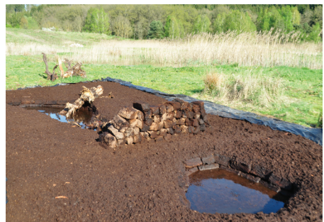
Abb. 8: Frisch angelegtes Hochmoor-Beet im Landschaftspark von Schloss Dennenlohe für weitere Erhaltungskulturen in größerem Maßstab.