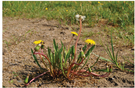
Abb 7: Blühender Doppelzähliger Löwenzahn ( Taraxacum geminidentatum ) ein Jahr nach der Auspflanzung. Foto: A. Kerskes, Mai 2012