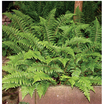
Abb. 5: Im Jahr 2003 initiierte Erhaltungskultur des vom Aussterben bedrohten Weichen Schildfarns ( Polystichum braunii ) aus dem Nationalpark Bayerischer Wald (Niederbayern).