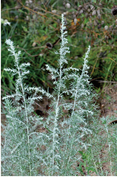
Abb. 1: Der Österreichische Beifuß ( Artemisia austriaca) von einem seit über 300 Jahren belegten Fundort bei Nürnberg befindet sich seit Jahrzehnten in Erlangen in einer Erhaltungskultur.

bayern- oder sogar deutschlandweit ihre letzten Wuchsorte in Mittelfranken. Daneben werden mit den seltenen endemischen Mehlbeeren-Arten ( Sorbus spp.) der Frankenalb (Abb. 3) Arten kultiviert, die weltweit nur hier vorkommen.