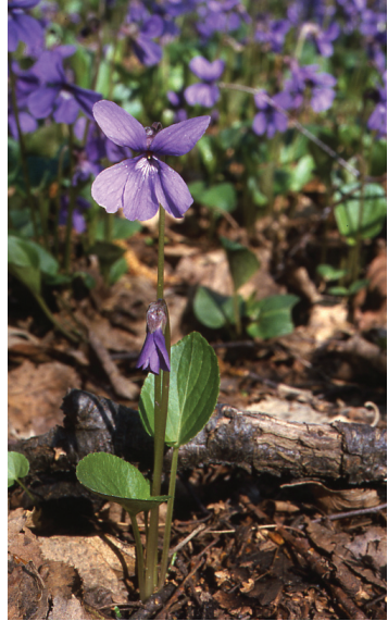
Abb 4: Das mittlerweile extrem seltene Moor-Weilchen ( Viola uliginosa ) in einem Moor-Bruchwald an einem seiner letzten deutschen Wuchsorte in der Lausitz (Sachsen).

Im Landschaftspark von Schloss Dennenlohe am Hesselberg wurden Flächen zur Verfügung gestellt, auf denen zukünftig einige der im Botanischen Garten Erlangen nachgezogenen