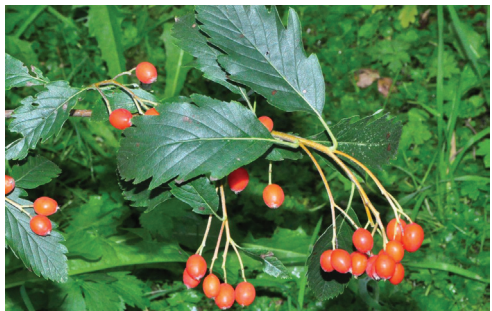
Abb. 3: Die Hohenester-Mehlbeere ( Sorbus hohenesteri) im Botanischen Garten Erlangen als Beispiel für eine Reihe z. T. sehr seltener endemischer Mehlbeeren der Frankenalb.