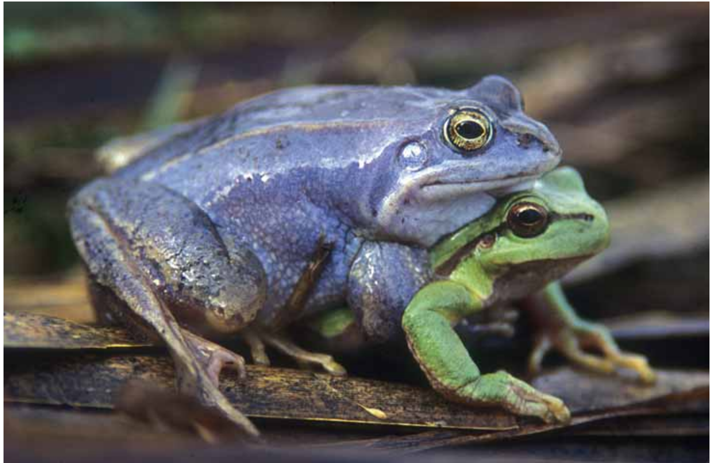
Fehlpaarung Moorfrosch Laubfrosch

Im Getümmel der Moorfroschlaichgruppen befinden sich oft auch einzelne Grasfrösche, die größer sind als Moorfrösche. Durch die „himmelblaue Brille“ sehen Moorfroschmännchen dann ein „Superweibchen“ und nicht selten versuchen gleich mehrere Moorfroschmännchen zugleich dieses Weibchen für sich zu gewinnen.