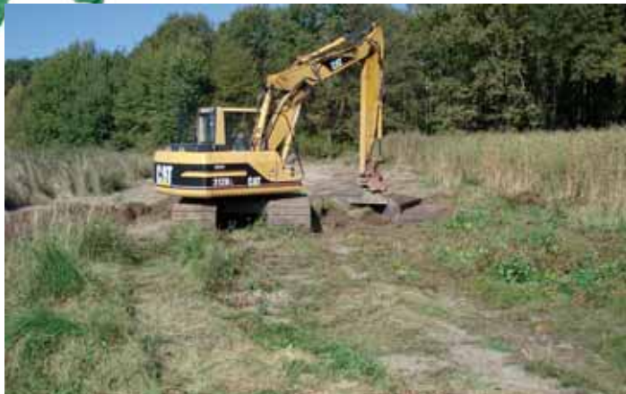
Abflachung eines Teichdammes

Bei vielen Teichen des Moorweihersprojektes handelte es sich um aufgelassene Teiche am Waldrand oder im Wald, die wegen schwankender Wasserstände fischereiwirtschaftlich uninteressant waren und meist durch Entbuschung, Dammsanierung und Wassereinstau erst wieder hergestellt werden mussten.