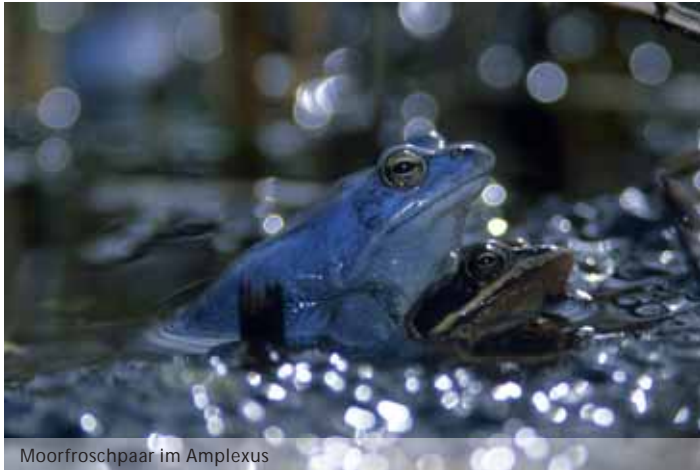
Moorfroschpaar im Amplexus