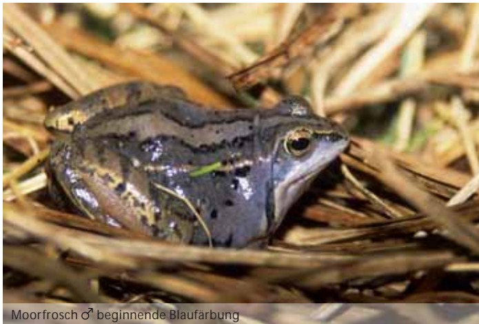
Moorfrosch ♂ beginnende Blaufärbung