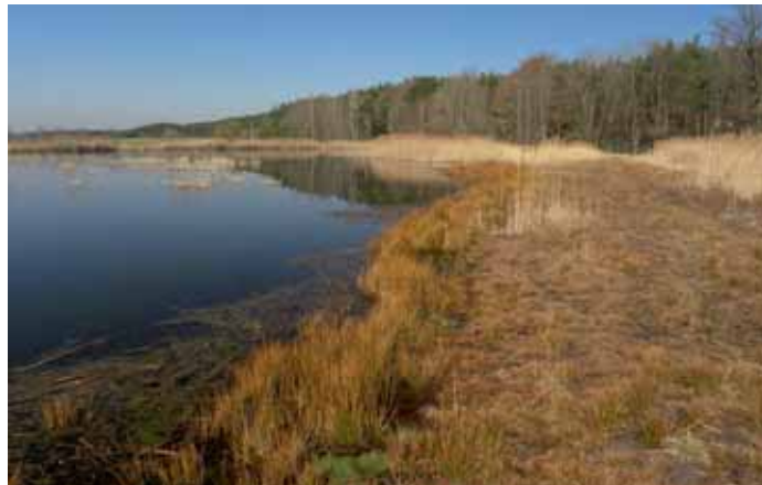
Gleicher Teichdamm wie links nach der Renaturierung

Früher wurden Seggen und Binsen in Teichflachmooren von den Landwirten im Winter über Eis gemäht und das Mahdgut wurde als Einstreu in den Ställen genutzt. Das ist heute zu zeitintensiv und wird von den Landwirten daher nicht mehr praktiziert. Dies führt langfristig dazu, dass die Verlandungszonen der Teiche verfilzen oder verbuschen. Amphibien, Vögel und Libellen benötigen im zeitigen Frühjahr jedoch besonnte, offene Teichränder mit Versteckmöglichkeiten unter Wasser. Abgestimmte Pflegemaßnahmen, wie z.B. die Wiederherstellung ehemaliger Teiche, Entbuschung im Winter über Eis und die Anlage von Flachwasserzonen führen dazu, dass Landschaftselemente und Zustände wieder hergestellt werden, die bei traditioneller Nutzung früherer Jahrhunderte als Nebenprodukt menschlicher Tätigkeit kostenlos entstanden sind. Dieser kulturhistorisch gewachsene Zustand ist es, der für die meisten gefährdeten und vom Aussterben bedrohten Tier- und Pflanzenarten überlebensnotwendig ist.