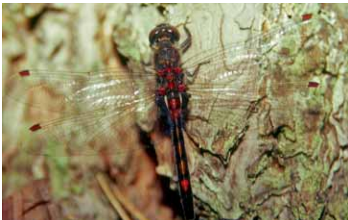
Nordische Moosjungfer ♂