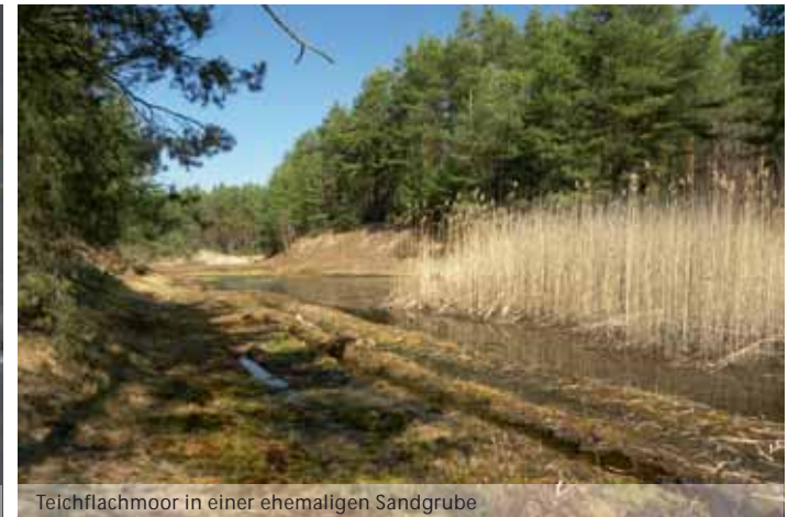
Teichflachmoor in einer ehemaligen Sandgrube