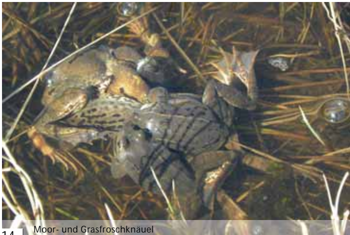
Moor- und Grasfroschknäuel