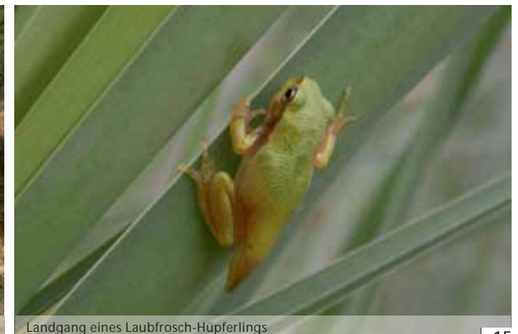
Landgang eines Laubfrosch-Hüpferrings