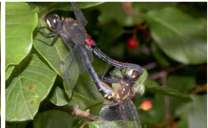
Kleine Moosjungfer, Paarungsrad