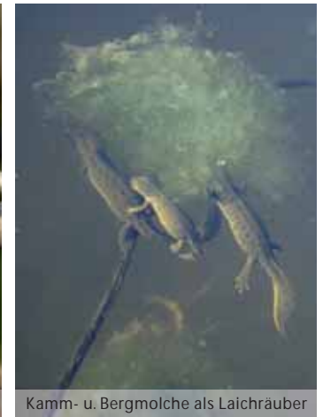
Kamm- u. Bergmolche als Laichräuber