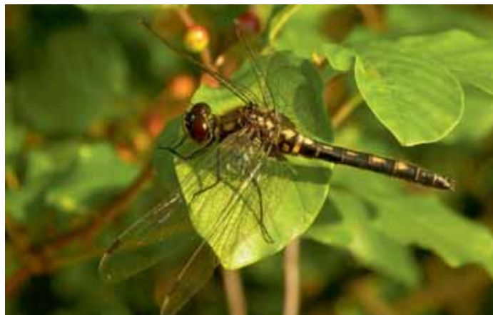
Kleine Moosjungfer ♀