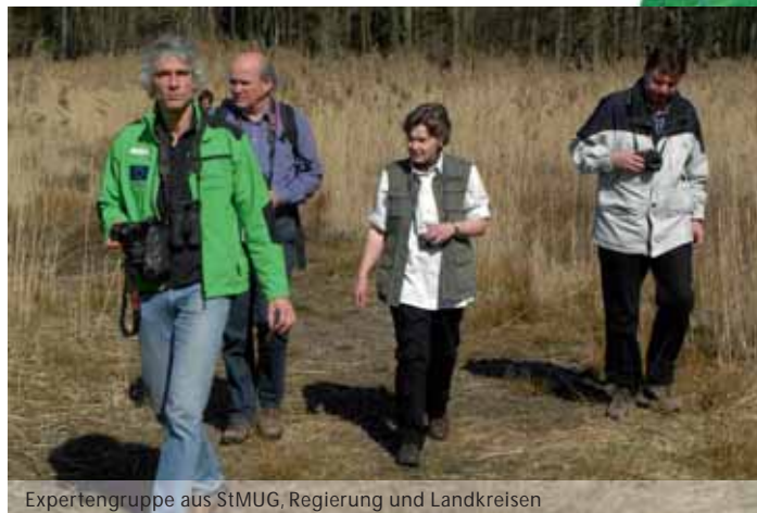
Expertengruppe aus StMUG, Regierung und Landkreisen

Viele Tiere reagieren auf Annäherung des Menschen mit Flucht, deshalb ist Besucherlenkung vor allem zur Laichzeit der Moorfrösche und während der Vogelbrutzeiten ein wichtiges Aufgabenfeld.