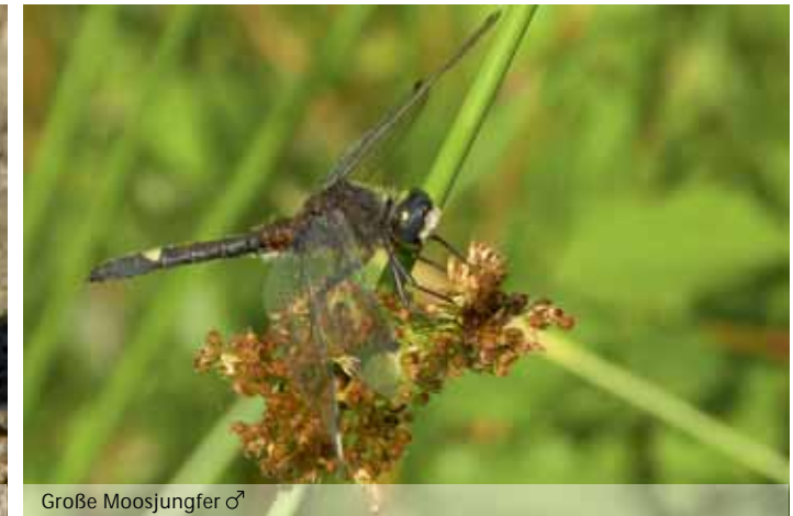
Große Moosjungfer ♂

Die Große Moosjungfer war in den 1990er Jahren nur noch an einer Hand voll Teichen mit einzelnen Individuen nachweisbar. Mittlerweile gibt es im Vergleich zum Beginn des Projekts 1996 mindestens doppelt so viele Teiche im Aischgrund, die ein stabiles Vorkommen dieser Libellenart aufweisen – Erfolg auf der gesamten Linie! Aufgrund dieser erzielten Erfolge bei Moorfrosch und Moorlibellenarten kann das Moorweiherprojekt mittlerweile als Pilotprojekt mit Vorbildfunktion gelten.