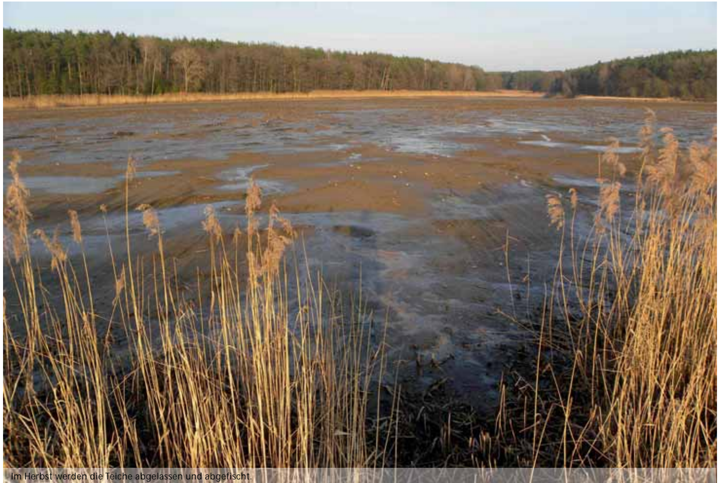
Im Herbst werden die Teiche abgelassen und abgefischt.

Karpfen erreichen nach 3 Jahren die Schlachtreife bei einem Gewicht von ca. 1,3 kg. Das Projekt „Karpfen pur Natur“ des Bund Naturschutz in Bayern e. V. bietet Karpfen an, die aus Naturteichen mit natürlicher Verlandung, ohne Zufütterung, Düngung oder Kalkung der Teiche stammen und in geringen Besatzdichten unter natürlichen Bedingungen gezüchtet wurden. In Naturteichen sind außer Karpfen meistens auch andere gefährdete Fischarten wie Bitterling, Moderlieschen oder Schlammpeitzger anzutreffen.