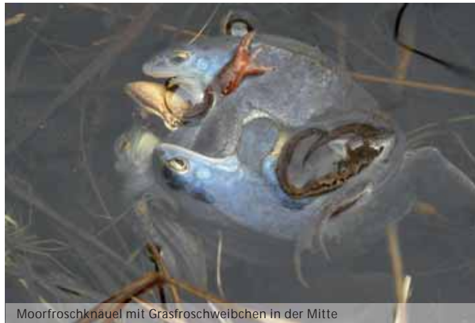
Moorfroschknäuel mit Grasfroschweibchen in der Mitte