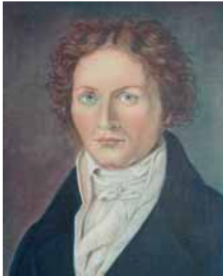
Johann Baptist Ritter von Spix (1781-1826)

wurde in Höchststadt an der Aisch geboren. Er studierte Philosophie, Theologie, Medizin und Naturwissenschaften, erhielt ein Stipendium von König Maximilian I. und erlernte in Paris die modernen Methoden der Zoologie. Danach baute er die zoologische Staatssammlung in München völlig neu nach modernen Kriterien auf. Er gilt als Begründer der heutigen zoologischen Staatssammlung.