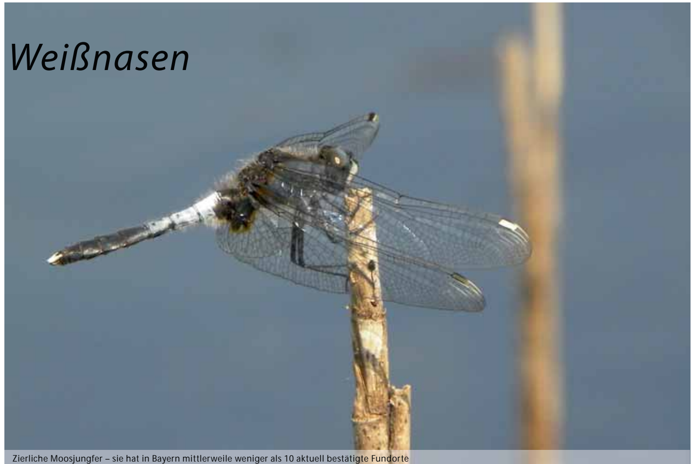
Zierliche Moosjungfer – sie hat in Bayern mittlerweile weniger als 10 aktuell bestätigte Fundorte

Moosjungfern benötigen als Lebensraum sehr saure Gewässer mit Torfmoosen, Seggen und Binsen als Versteckmöglichkeiten für ihre Larven. Die Larven der Moosjungfern benötigen 3 Jahre für ihre Entwicklung zur Libelle und werden gerne von Fischen gefressen. Deshalb müssen ihre Gewässer zwar dauerhaft wasserführend sein, dürfen aber keinen Fischbesatz aufweisen. Das sind sehr spezielle Anforderungen, die nur wenige Teiche erfüllen.