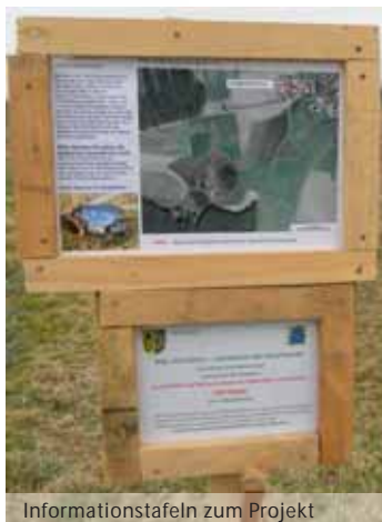
Informationstafeln zum Projekt

Der unscheinbar wie Gras aussehende Pillenfarn wächst am Gewässergrund von Teichflachmooren, ist aber eine echte Farnpflanze.