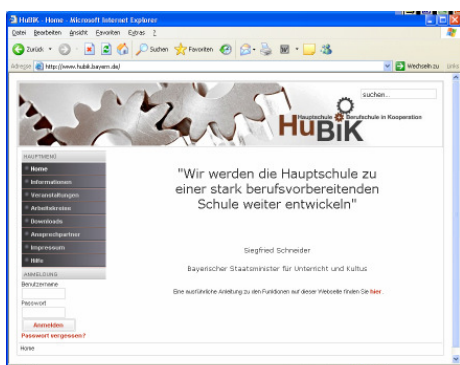
Grafik: Roland Karl, Städt. BS 6, Nürnberg, 10. Klasse, Mediengestalter

Alle Mitglieder der Arbeitskreise können mit Hilfe einer Up- und Downloadfunktion Dateien in den Downloadbereich laden und diese dann anderen Arbeitskreisen zur Verfügung stellen. Darüber hinaus ist es möglich, Fragen und Informationen in ein gemeinsam genutztes Forum einzustellen, Artikel auf der Seite zu veröffentlichen und interessante Webseiten einer Linksammlung hinzuzufügen.