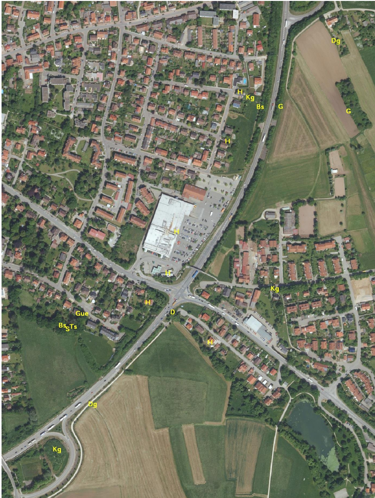
Abb. 5: Fundorte und Brutrevierzentren artenschutzrechtlich relevanter Vogelarten im Untersuchungsraum. Bs = Buntspecht (Revier im Südwesten / einmaliger Nachweis ohne Brut an B2-Baumhecke); D = Dohle (einmaliger Nachweis, kein Brutplatz); Dg = Dorngrasmücke (Revier); G = Goldammer (Revier); Gue = Grünspecht (Revier); H = Haussperling (Revier); Kg = Klappergrasmücke (Revier); S = Star (Revier).