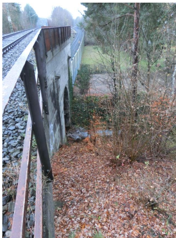
Abb. 8 Blick von der EÜ Überwerfungsbauwerk auf die EÜ km 54,409 Entengraben und den Entengraben in Richtung Treuchtlingen