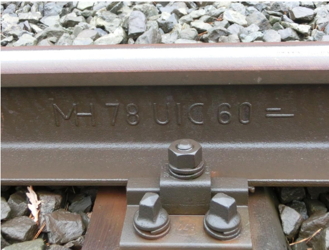
Abb. 6 Walzmarke