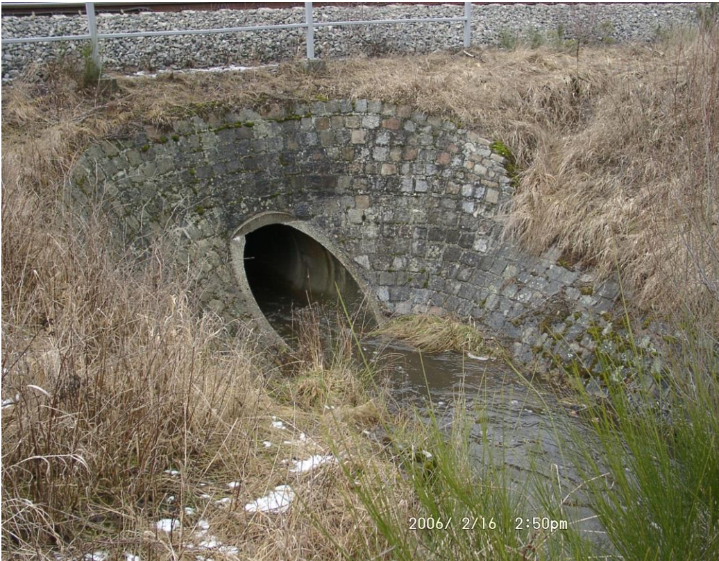
Abb. 15 Zulaufbauwerk Entengraben