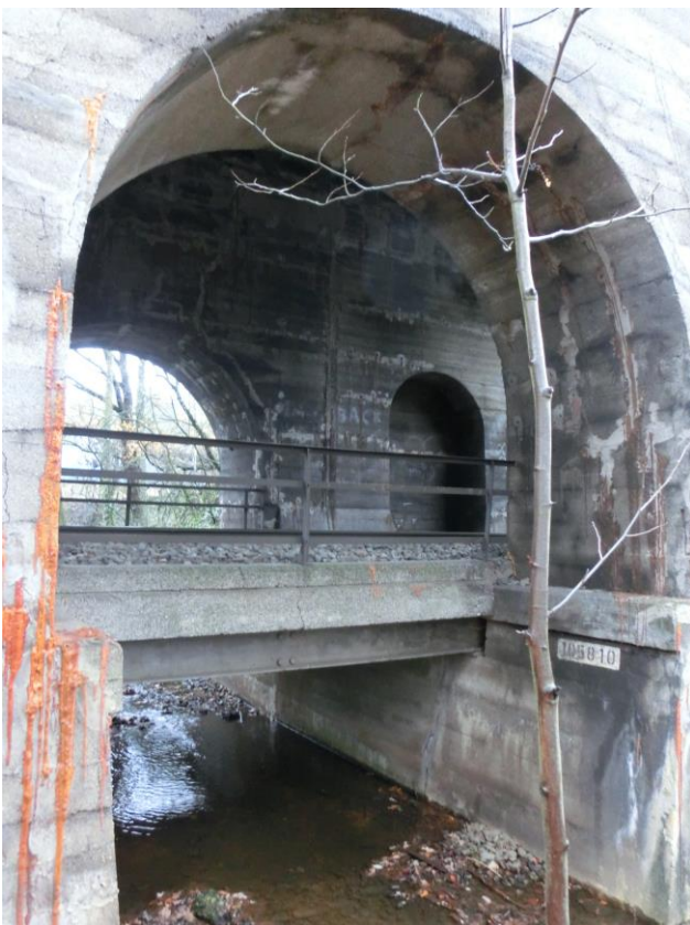
Abb. 14 Entengraben, EÜ km 54,409 Entengraben, EÜ km 54,410 Überwerfungsbauwerk