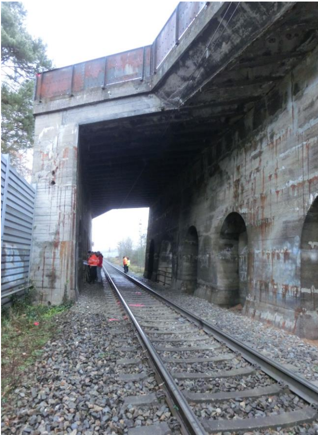
Abb. 13 EÜ km 54,409 Entengraben, Blickrichtung nach Nürnberg