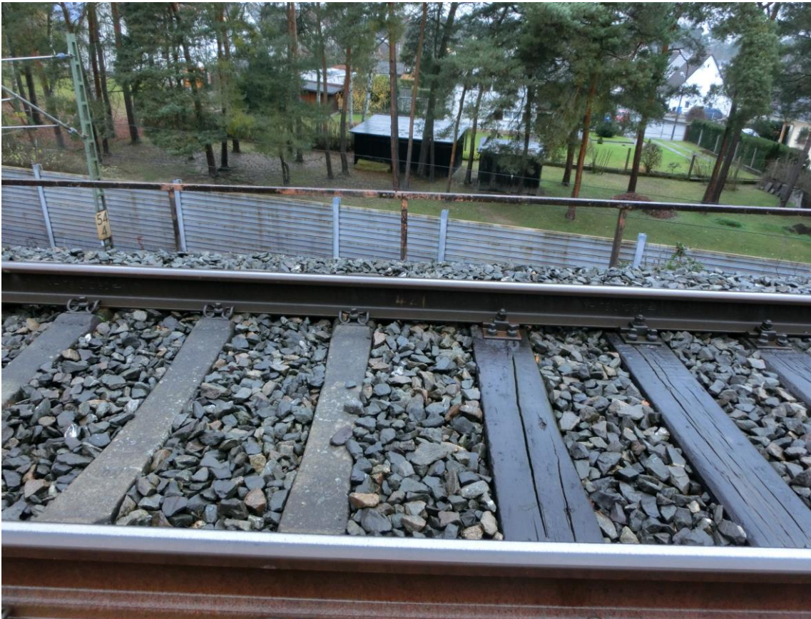
Abb. 5 Schwellenartwechsel des RiGl am südlichen Widerlager