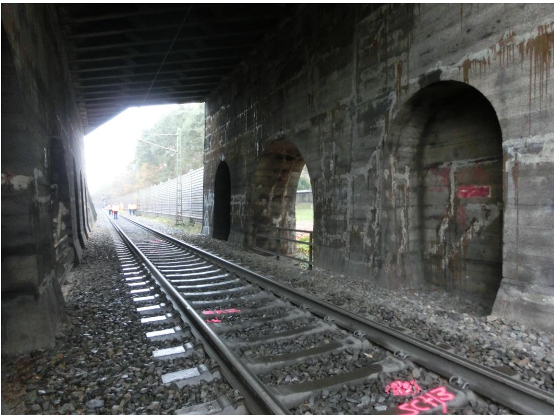
Abb. 12 EÜ km 54,409 Entengraben unter dem Überwerfungsbauwerk, Richtung Treuchtlingen