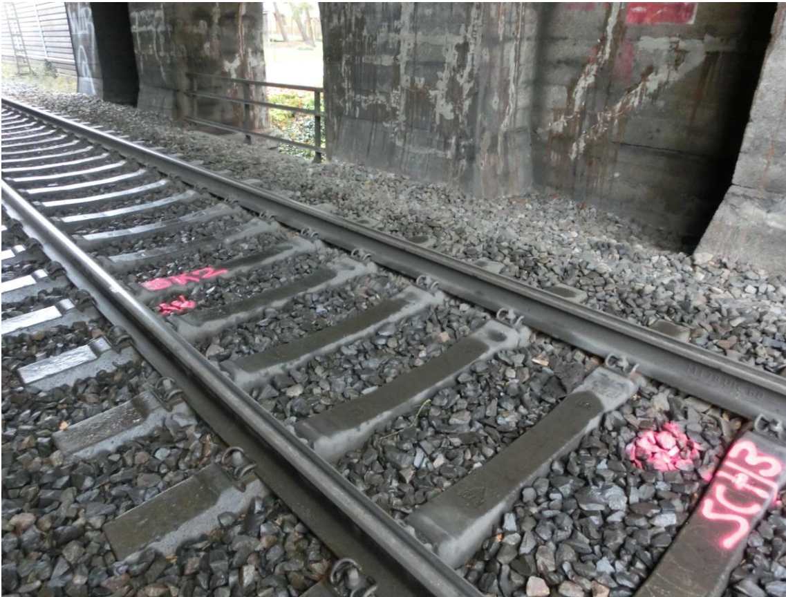
Abb. 9 GRiGI auf der EÜ km 54,409 Entengraben