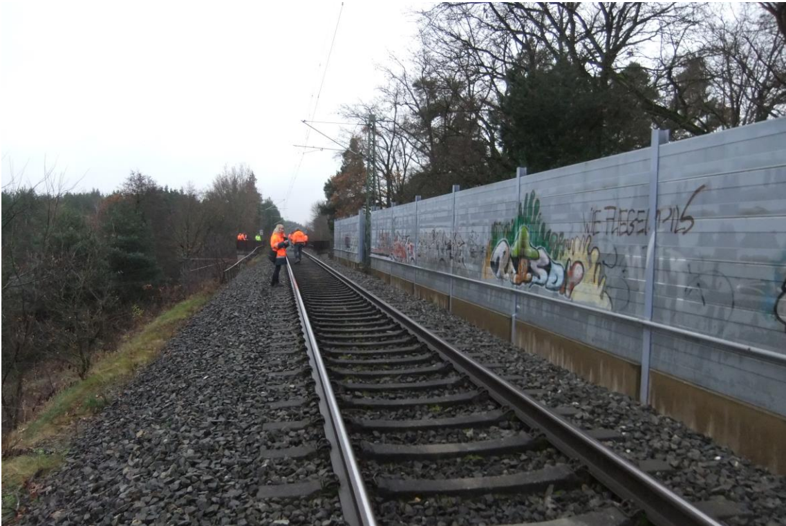
Abb. 1 RiGI vor dem nördlichen Widerlager, Richtung Treuchtlingen