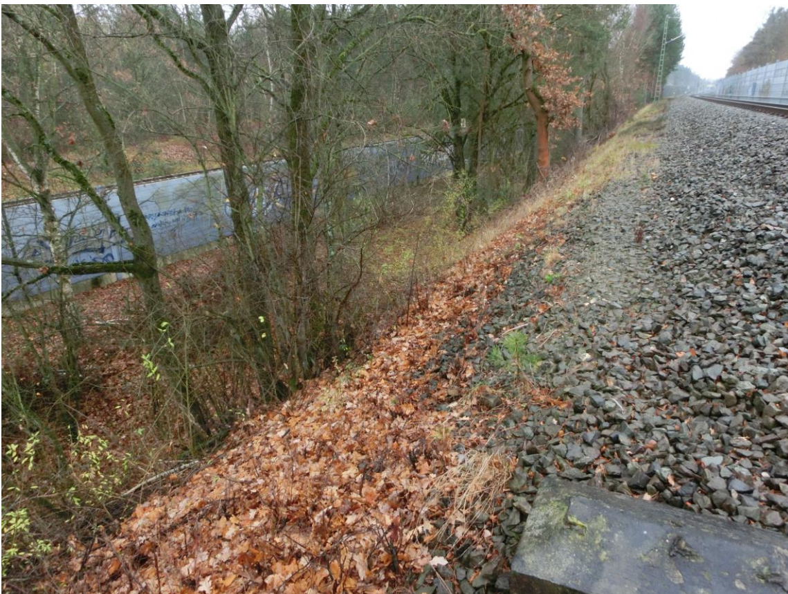
Abb. 4 Böschung am südlichen Widerlager des RiGI, Richtung Treuchtlingen