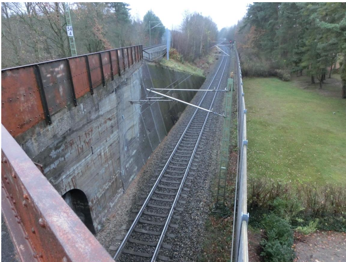
Abb. 7 Blick von der EÜ km 54,410 Überwerfungsbauwerk auf die EÜ km 54,409 Entengraben, Richtung Treuchtlingen