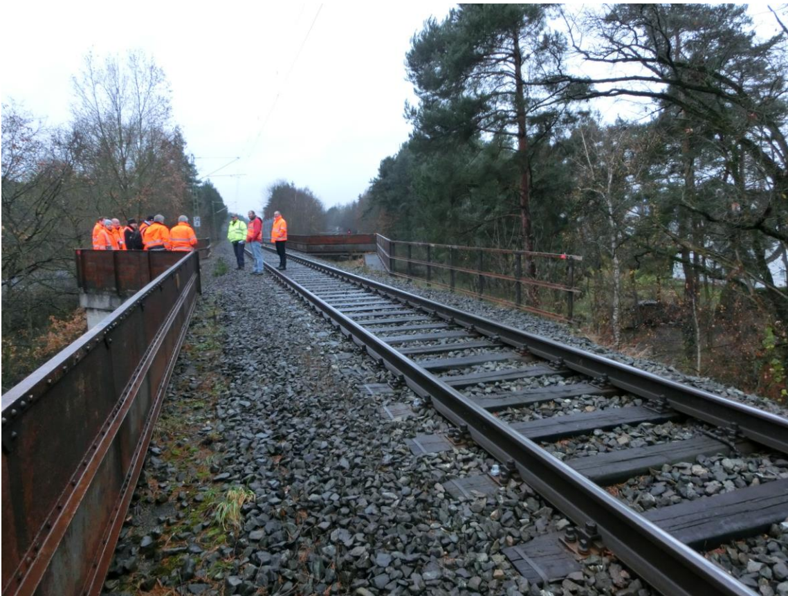
Abb. 3 RiGI, Richtung Treuchtlingen