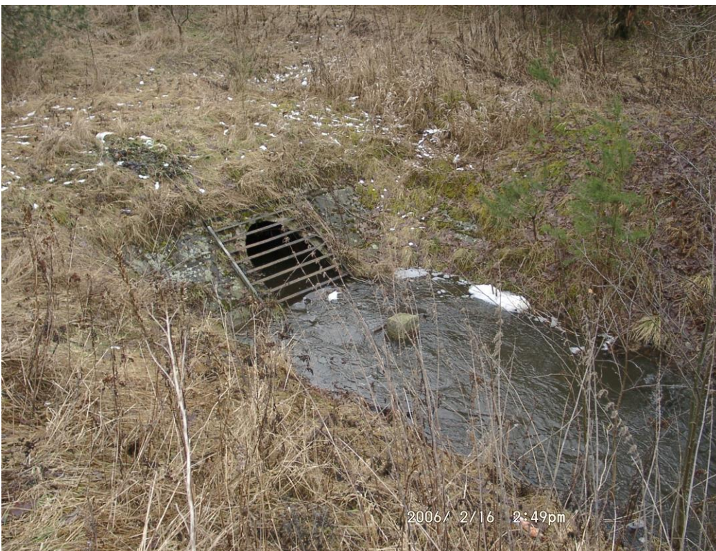
Abb. 16 Auslaufbauwerk Entengraben