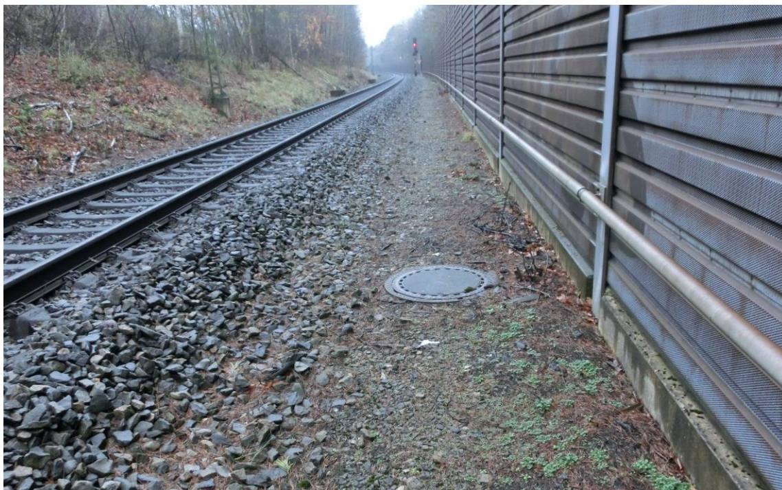
Abb. 10 Tiefenentwässerung am GRiGI