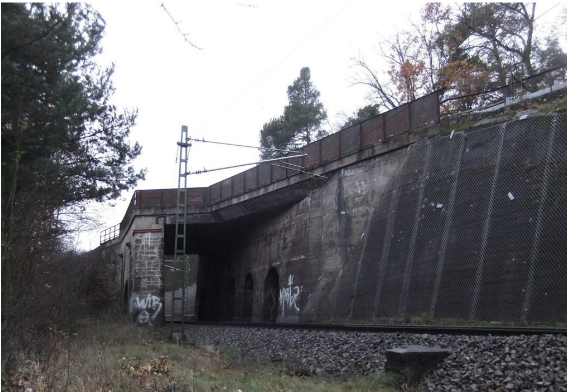
Abb. 11 EÜ km 54,409 Entengraben, Richtung Treuchtlingen